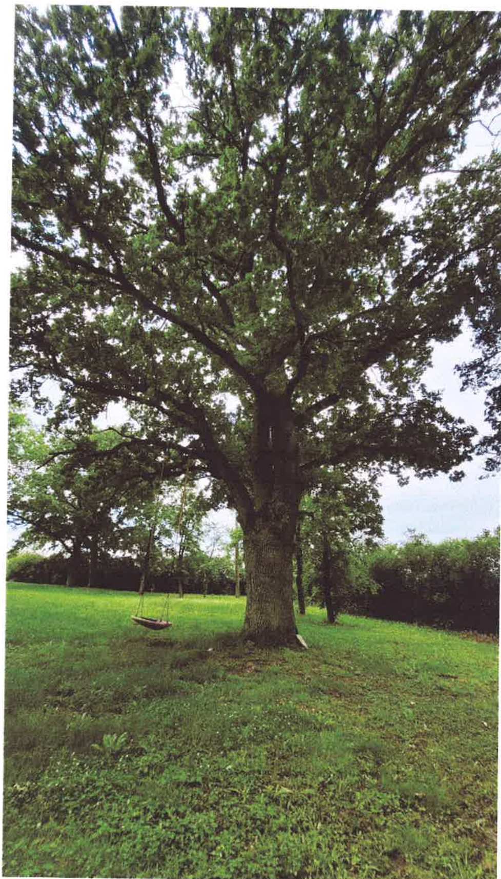
Fotografia drzewa 01- dąb szypułkowy ( Quercus robur )

Lokalizacja - działka nr 192/2 obręb Mirowo X 568835,4051 Y 191633,7809